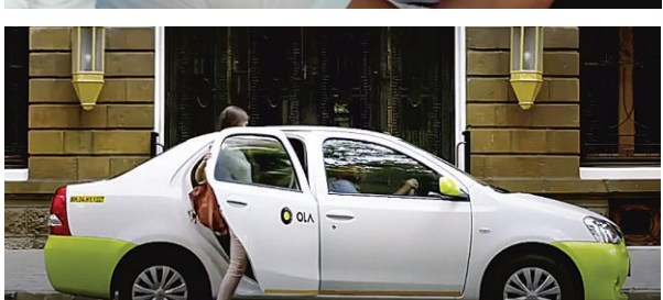
The #MySafestRide campaign relies on user accounts and driver experiences to reassure riders of the safety protocols being adopted by the brand

It is important to do that since several surveys have indicated that people are wary of travelling by anything but private vehicles. In a survey conducted in April-May, Deloitte reported that in India, 73 per cent of the respondents were planning to limit the use of ridehailing cabs over the next three months (State of the Consumer Tracker, covered 13 countries with 1,000 individual responses per country/wave). In a report released in April, market research agency Kantar found that 35 per cent said that they would stop using ride-hailing transport completely while 41 per cent said they would cut its use. The Kantar survey was conducted with a sample of 1000+ covering 19 cities and 15 states across India.