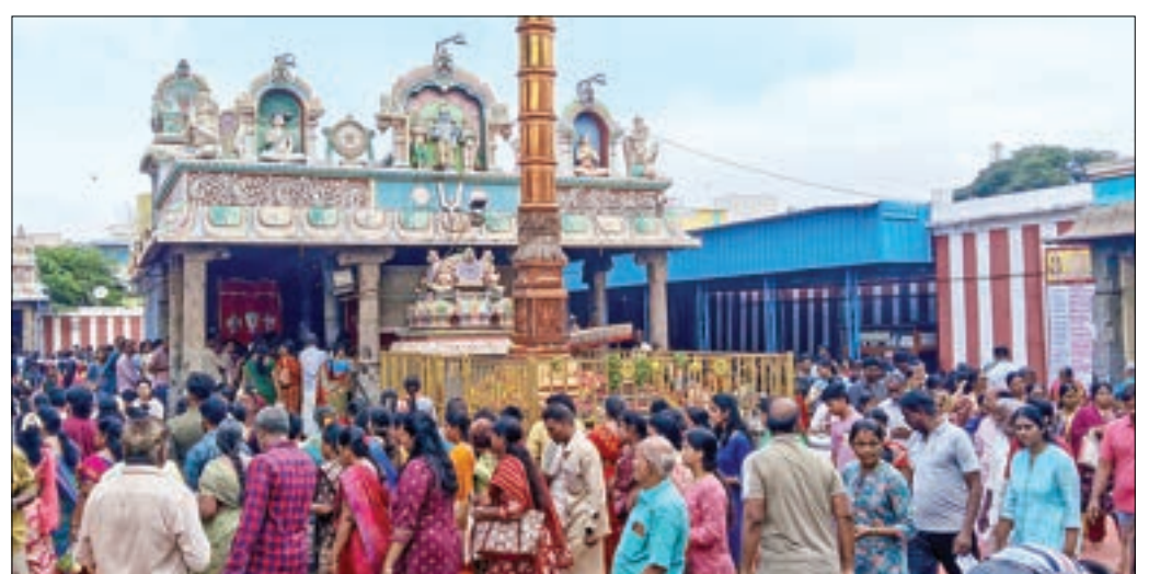
▶ வைகாசி மாதம் முதல்நாள் விஷ்ணுபதி புண்ணிய காலத்தை முன்னிட்டு, நேற்று பெருமாள் கோயில்களில் 27 முறை வலம் வந்த பக்தர்கள். இடம்: வில்லிவாக்கம் தாமோதர பெருமாள் கோயில்.

தவிர்த்திருக்க வேண்டும். விசிக தலைவர் திருமாவளவன்: பெட்ரோல்-டீசல் விலையை லிட்டருக்கு ரூ.3 என உயர்த்தியிருப்பதன் மூலம் பாஜக அரசு எளிய மக்களின் அடிவயிற்றில் கை வைத்துள்ளது. இதனால் மிகவும் பாதிக்கப்பட்ட போவது விளம்புநிலையைச் சார்ந்த ஏழை-எளிய உழைக்கும் மக்கள்தான். அமரக பொதுச்செயலாளர் டிடிவி. தினகரன், தவக தலைவர் வேல்முருகன், ஆம்னி பேருந்து உரிமையாளர்கள் கச்சா எண்ணெய் விலை உயர்வின் தாக்கத்தை இயல்பாகவே எண்ணெய் நிறுவனங்களும், மத்திய அரசும் தாங்கிக் கொண்டு விலை உயர்வை