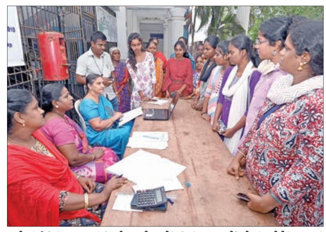
▶ பிளஸ் 2 தேர்வு முடிவுகள் வெளியான நிலையில், சென்னை ராணிமேரி கல்லூரியில் மாணவர் சேர்க்கைக்கான உதவி மையம் அமைக்கப்பட்டுள்ளது. இதில் மதிப்பெண் அடிப்படையில் எந்த பாடப்பிரிவு எடுப்பது குறித்து ஆலோசனை வழங்கப்படுகிறது.

மேலும், கூவம் ஆறுகளில் விடப்படும் ஒருமுறை மட்டும் பயன்படுத்தப்படும் தெர்மோகோல் பெட்டிகளை முற்றிலும் மாசு தலைவர், மீனவர் நலத் துறை இயக்குநர், காசிமேடு மீன்பிடி துறைமுக மேலாளர் ஆகியோர் அடங்கிய தூய்மைப் பணிக்கான கூட்டுக்குழு வையும் அமைத்து உத்தரவிட்டுள்ளது. சென்னை துறைமுக வளாகத்துக்குள்ளாகவோ, கடற்கரை ஓரங்களிலோ பிளாஸ்டிக் மற்றும் தெர்மோகோல் குப்பைகளை கொட்டுபவர்களுக்கு கடுமையான அபராதம் விதிக்க உரிய நடவடிக்கைகளை எடுக்கவும் அதிகாரிகளுக்கு தீர்ப்பாயம் உத்தரவிட்டுள்ளது.